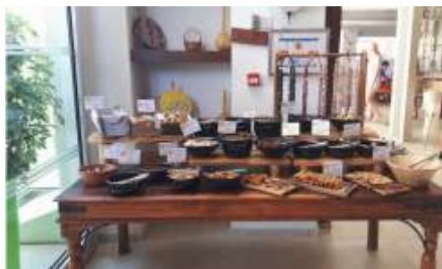
Olympic Lagoon Resort Αγία Νάπα

Τον Μάιο, έγιναν επισκέψεις σε ξενοδοχεία στην Πάφο, Πρωταρά και Αγία Νάπα. Στη γωνιά του Κυπριακού Προγεύματος το μπουφέ φιλοξενεί μια μεγάλη ποικιλία γεύσεων δίδοντας στους τουρίστες μια μοναδική γαστρονομική εμπειρία. Οι τουρίστες μπορούν να δοκιμάσουν τις παραδοσιακές νοστιμιές και τα αρώματα μέσω των τοπικών προϊόντων του τόπου μας, συνδυάζοντας το γαστρονομικό μας πλούτο με τη φιλοξενία μας.