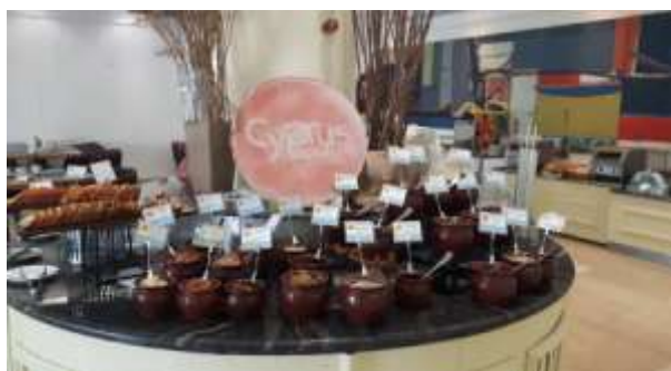
Louis Imperial Beach Hotel

Τον Ιούνιο και Ιούλιο, οι επισκέψεις συνεχίστηκαν σε Πάφο, Πόλη Χρυσοχούς, Λεμεσό, Λάρνακα, Λευκωσία και ορεινές περιοχές. Τα ξενοδοχεία προσφέρουν παραδοσιακές γεύσεις με προϊόντα που προέρχονται από τοπικούς παραγωγούς, επιτυγχάνοντας ποιοτική αναβάθμιση και αντιστοίχως οι επισκέπτες απολαμβάνουν μια καλύτερη γαστρονομική εμπειρία. Η φρεσκάδα των προϊόντων και οι σπιτικές συνταγές συνδέονται με την κουλτούρα και την παράδοση της Κύπρου.