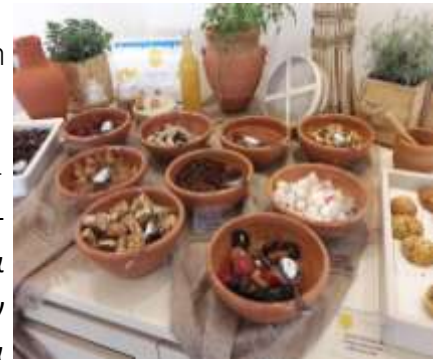
Nissi Beach Resort

Τα πιο πάνω ξενοδοχεία στηρίζουν το Κυπριακό Πρόγευμα και αναδεικνύουν την κυπριακή ταυτότητα παρέχοντας μια σειρά από τοπικά προϊόντα στους επισκέπτες τους. Το μπουφέ διαθέτει μια μεγάλη ποικιλία από κυπριακά προϊόντα όπως το παραδοσιακό χαλούμι και αναρί, την παραδοσιακή σπιτική χαλλουμόπιττα και ελιόπιττα και φρέσκα τοπικά προϊόντα που συνάδουν με την αυθεντικότητα της Κύπρου.