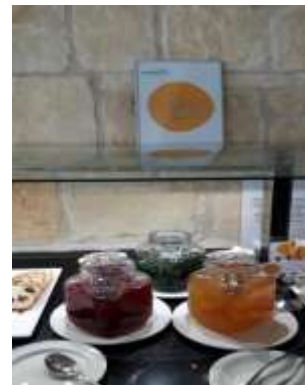
Akti BeachVillage Resort

Τον Ιούνιο και Ιούλιο, οι επισκέψεις συνεχίστηκαν σε Πάφο, Πόλη Χρυσοχούς, Λεμεσό, Λάρνακα, Λευκωσία και ορεινές περιοχές. Τα ξενοδοχεία προσφέρουν παραδοσιακές γεύσεις με προϊόντα που προέρχονται από τοπικούς παραγωγούς, επιτυγχάνοντας ποιοτική αναβάθμιση και αντιστοίχως οι επισκέπτες απολαμβάνουν μια καλύτερη γαστρονομική εμπειρία. Η φρεσκάδα των προϊόντων και οι σπιτικές συνταγές συνδέονται με την κουλτούρα και την παράδοση της Κύπρου.