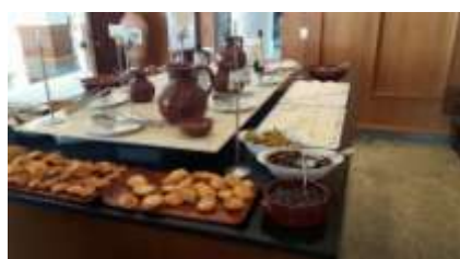
Constantinos the Great