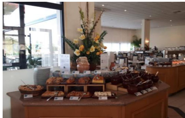
Louis Phaethon Beach Hotel