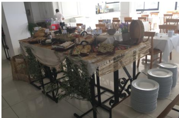
Anmaria Beach Hotel

Στη γωνιά του Κυπριακού Προγεύματος οι επισκέπτες μπορούν να δοκιμάσουν τις παραδοσιακές νοστιμιές και τα αρώματα μέσω των τοπικών προϊόντων του τόπου μας, συνδυάζοντας το γαστρονομικό μας πλούτο με τη φιλοξενία μας.