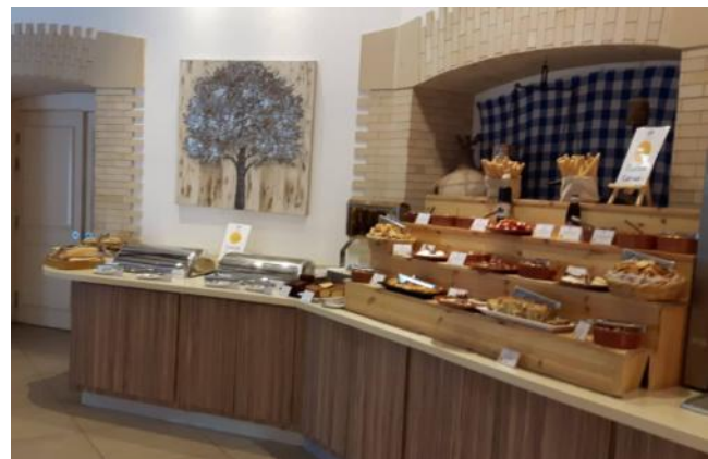
Aphrodite Hills Resort