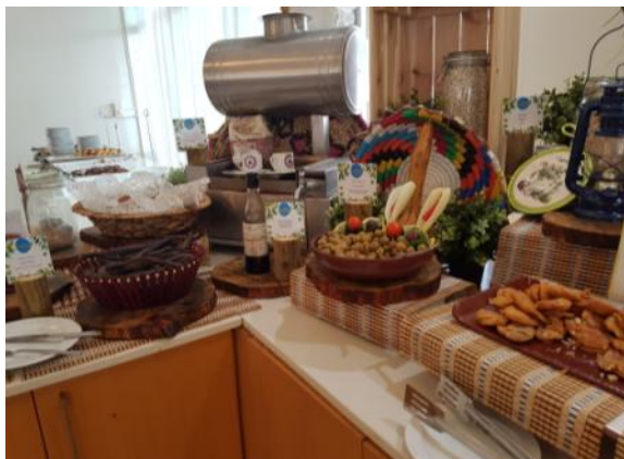
Dome Beach Hotel